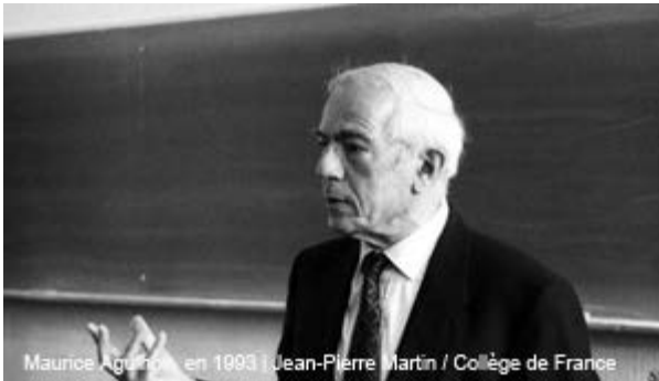
Maurice Agulhon en 1993

L'historien français Maurice Agulhon, professeur au Collège de France, est mort, mercredi 28 mai 2014, à l'âge de 87 ans. En 2010, il avait fait don de l'essentiel de ses livres de travail, à la Bibliothèque Universitaire d'Avignon, qui avait ainsi accueilli dans ses collections un fonds considérable, très spécialisé, riche de documents rares et précieux. Une exposition de cette bibliothèque de travail avait d'ailleurs eu lieu du 1er au 30 septembre 2010.