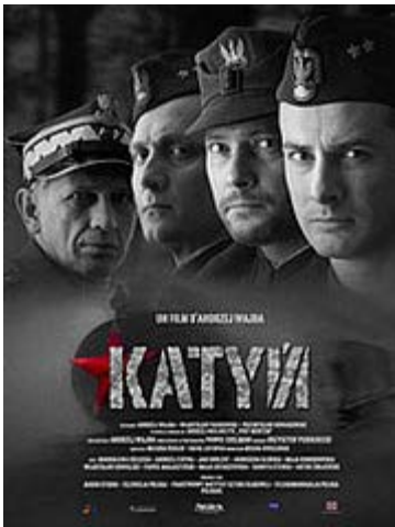
Katyn Andrzej Wajda, 2009

Vous trouverez ci-dessous une sélection de films en hommage à Andrzej Wajda , qui nous a quittés récemment. A emprunter dans l'espace Images et actualités.